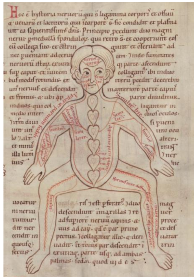
Figure 1– Représentation schématique de l'organisation nerveuse et de la liaison à la moelle épinière (manuscrit datant d'environ 1165 : Munich, Bayerische Staatsbibliothek, Clm 13002, folio 3r).

perspective médicale, la connaissance des choses « selon leur apparence » serait suffisante au succès opératoire en termes de diagnostic, pronostic et thérapeutique. C'est pourquoi dans la subdivision consacrée à la faculté motrice volontaire, Avicenne affirme que cette dernière est celle qui permet de contracter et relâcher les tendons grâce auxquels sont mues les parties corporelles et les articulations, sous l'effet de la dilatation et de la flexion. Il indique également que cette faculté pénètre dans ces parties corporelles grâce aux nerfs en continuité avec les muscles et que le mouvement volontaire ne s'accomplit dans un membre que s'il reçoit du cerveau et par l'intermédiaire des nerfs la faculté motrice. Au contraire, Averroès (1126- 1198), à la fois philosophe et médecin comme Avicenne, n'a accordé aucun crédit aux théories de Galien dans son œuvre médicale Kitab al-kulliyat fil-tibb ou Colliget (9). Le muscle serait bel et bien impliqué dans le mouvement volontaire (du moins chez les animaux qui effectuent de tels mouvements), cependant les médecins auraient une opinion inexacte quand ils soutiennent que le mouvement du muscle se produit